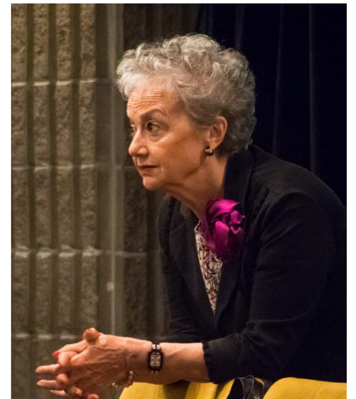
La sala nell'attesa