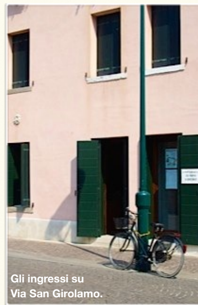
Gli ingressi su Via San Girolamo.