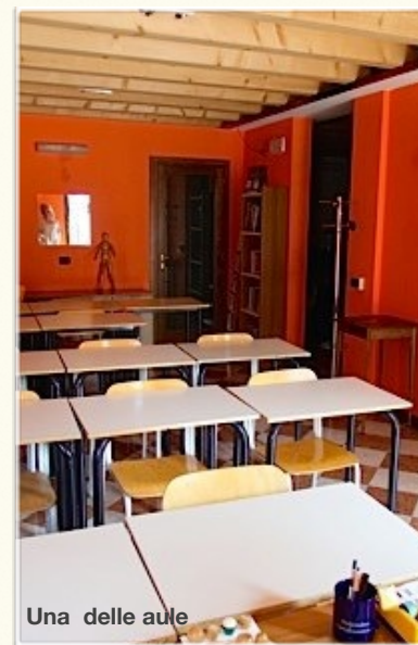
Una delle aule

SEGRETERIA: v. San Girolamo, da lunedì a venerdì ore 9,30 – 11,30 Tel. e fax 041 984529 – cell. 333 8890222 URL: www.utlmestre.it e-mail: utlmestre@libero.it