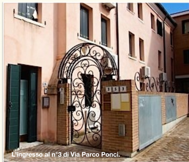
L'ingresso al n°3 di Via Parco Ponci.